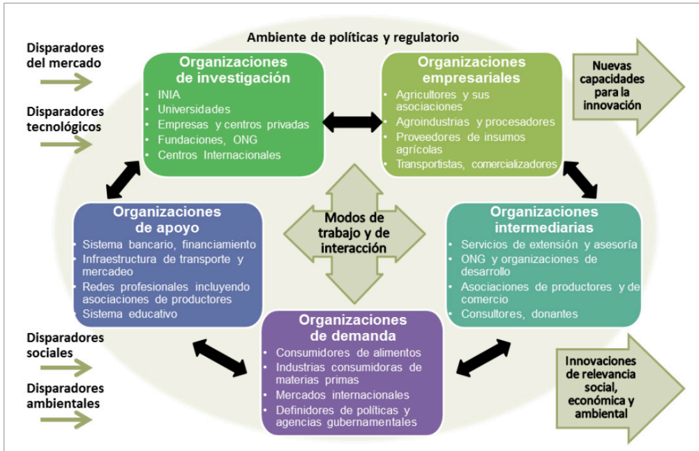
Figura 2. Dinámica del sistema de innovación.

presente que, en temas de tecnología, algunas opciones realmente disruptivas para la agricultura no se originan en este sector, como es el caso de las herramientas de la agricultura digital.